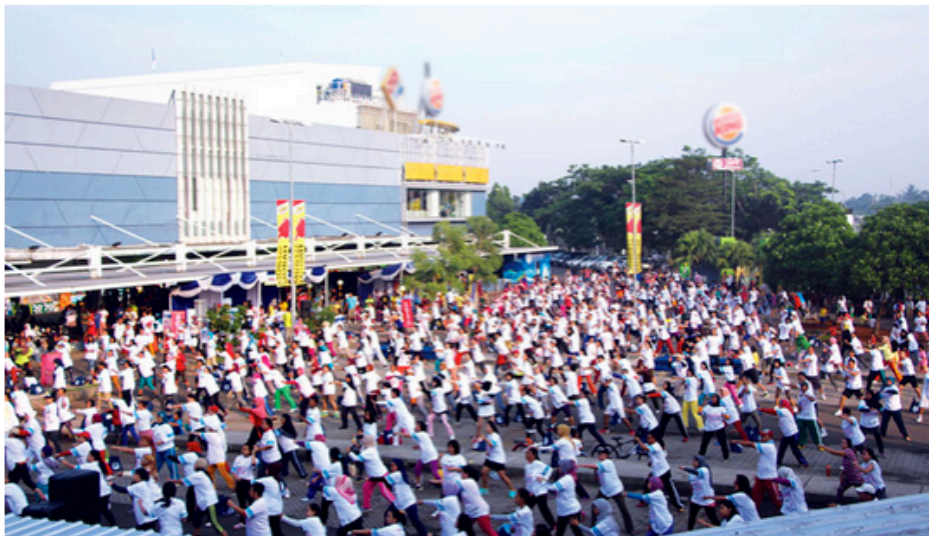
Keramaian peserta senam sehat Hero Group

ShareThis 4 Google+ 0 Facebook Share 0 Tweet 0 LinkedIn Share 0 Pinterest 0