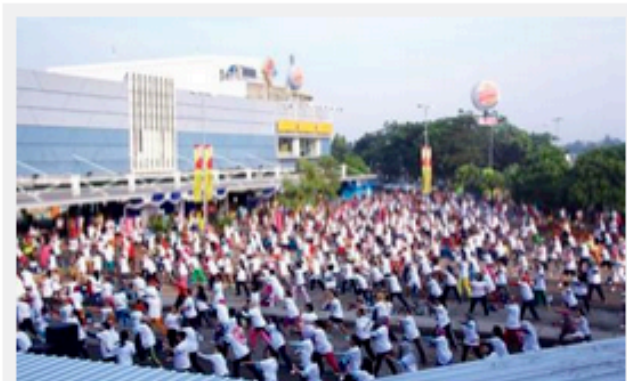
Suasana keramaian peserta Senam Sehat HERO Group "Show Your Move with The Groove"

Gaya hidup sehat sedang menjadi tren di kalangan masyarakat saat ini. Setiap orang berlomba memamerkan gaya hidup sehat mereka di sosial media. Namun, terkadang untuk menjalani gaya hidup tersebut di sela-sela kesibukan pekerjaan kantor atau deadline tugas kantor membuat hal tersebut menjadi sulit.