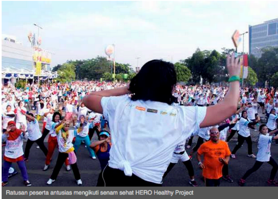
Ratusan peserta antusias mengikuti senam sehat HERO Healthy Project

BINTARO - Ratusan warga antusias mengikuti senam sehat aerobik dan Zumba bersama HERO Healthy Project di area parkir Giant CBD, Bintaro, Minggu (23/11). Senam sehat ini diadakan untuk memenuhi keinginan warga yang menginginkan gaya hidup sehat di sela-sela padatnya aktivitas kerja di kantor.